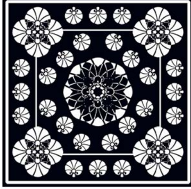
Bandananın açık hali

- Bandana mermerşahi veya tülbent kullanılarak üretilcek.