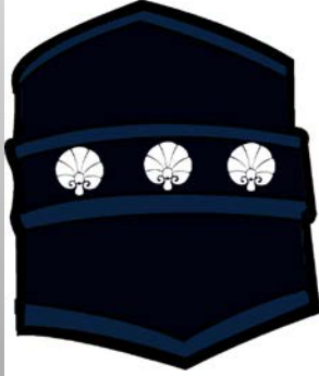
Bilekliğin açık hali