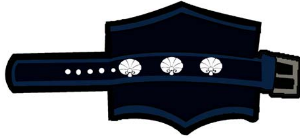
Bilekliğin açık hali